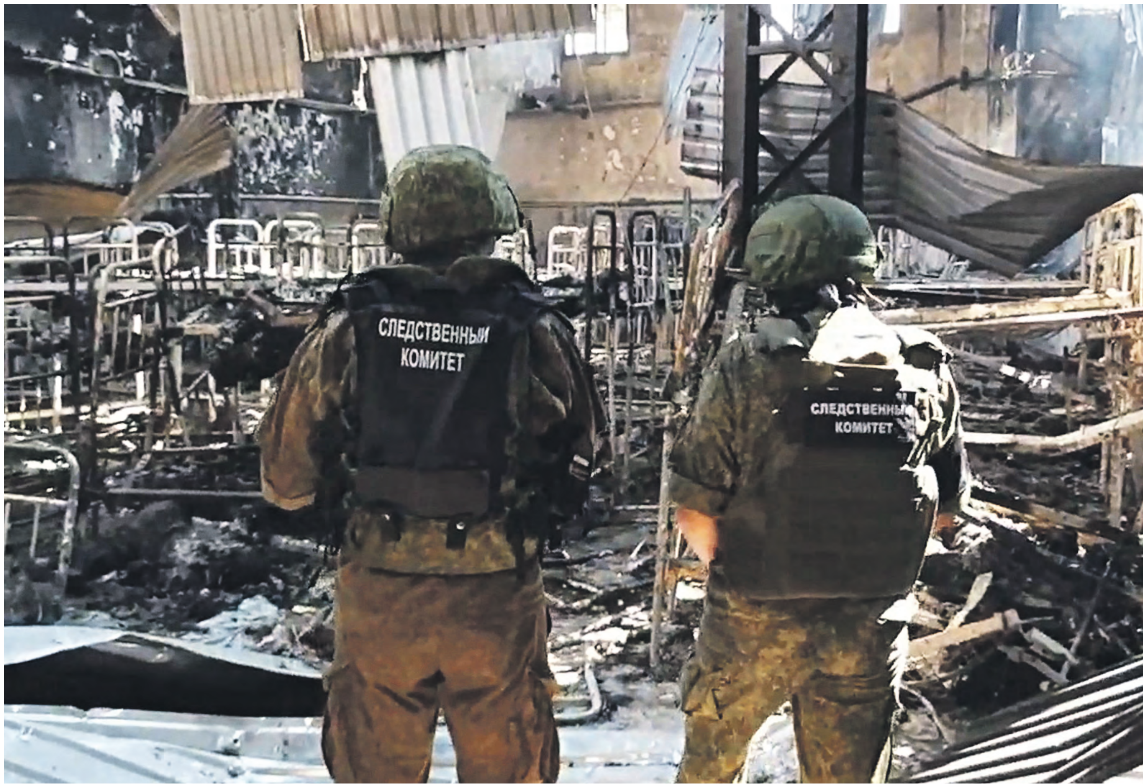
29 июля 2022 года. Донецкая Народная Республика, Еленовка. Следственный изолятор, где содержались сдавшиеся в плен участники батальона «Азов», который был обстрелян украинскими вооруженными силами

тысячи уголовных дел возбуждено СК Российской Федерации в отношении руководства Украины.