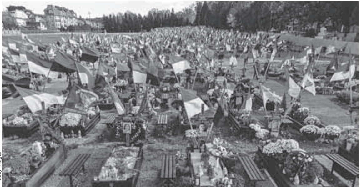
Русофобская политика киевских неонацистов обернулась смертями тысяч простых украинцев. Кладбище, подобных этому во Львове, в стране появилось множество.

Особенно беспокоит, что насильственное принуждение к неонацистской идеологии и ярая русофобия уничтожают некогда процветающие города Украины, в том числе Харьков, Одессу, Николаев, Днепропетровск.