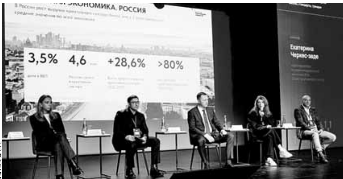
В Саратовской области планируется создание пошаговых дорожных карт для развития индустрий-драйверов.

требителям в беззаявительном порядке был проведен перерасчет платы за горячую воду на 19 млн рублей. Губернатор Роман Бусаргин подчеркнул, что Государственная жилищная инспекция должна на постоянной основе отстаивать права людей и пресекать нарушения, связанные с предоставлением некачественных коммунальных услуг.