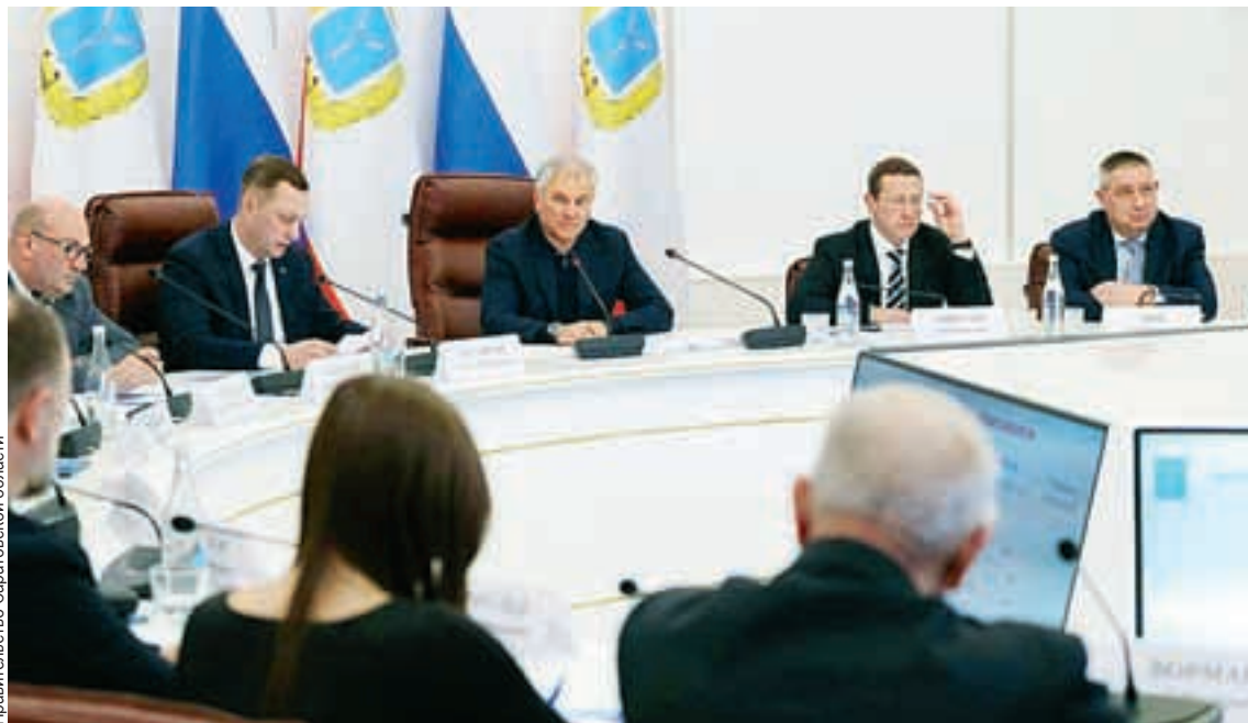
Вячеслав Володин обратился к руководству области с пожеланием увеличить эффективность работы.

- Необходимо сохранять населенные пункты, создавать социальную инфраструктуру села, - отметил Володин, призвав отказаться от оптимизации сельских школ.