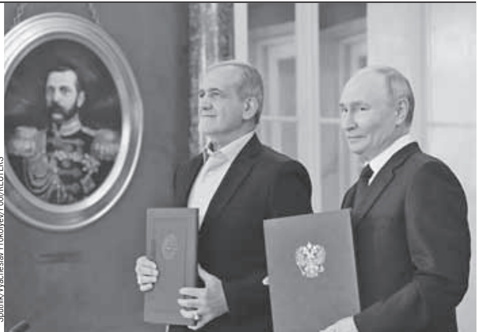
Два президента один император: Владимир Путин и его иранский коллега Масуд Пезешкиан под пристальным взглядом Александра II.

- Реализация этого проекта помогла бы наладить бесшовную логистику от России и Белоруссии до иранских портов в Персидском заливе, - сказал российский президент.