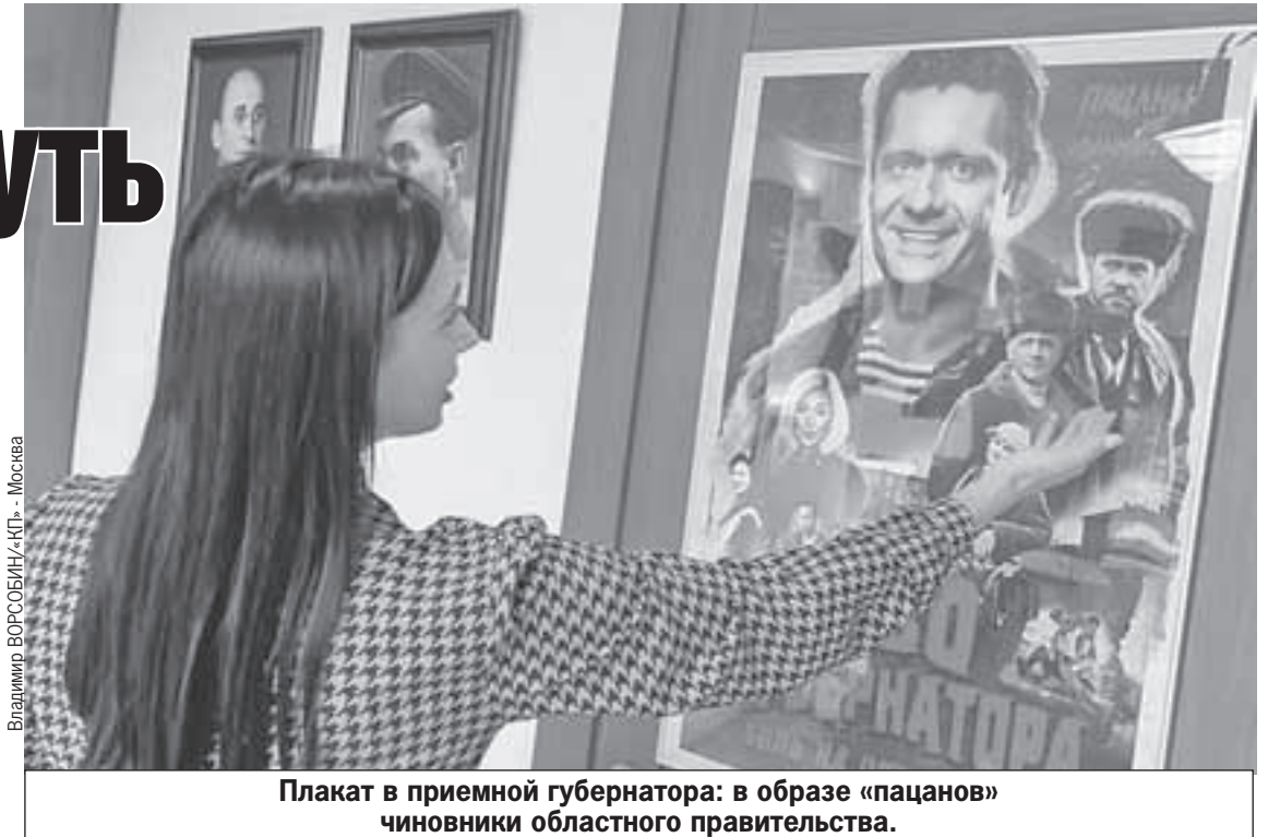
Плакат в приемной губернатора: в образе «пацанов» чиновники областного правительства.

Как же хочется увидеть Вологду в начале марта. В преддверии женского дня, прогуляться по магазинам. В полдень. В эти заветные