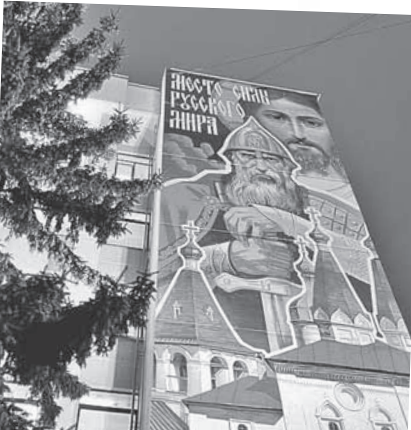
Такой плакат с былинным богатырем и надписью про то, что здесь «место силы Русского мира», висит на здании рядом с администрацией.

А вот в Вологде интересно. Тут обратный эксперимент.