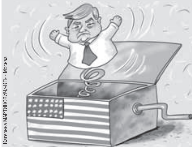
Катерина МАРТИНОВИЧ/«КП» - Москва

- Трамп будет жестко действовать в американских интересах. Но в отличие от Байдена он не маньяк, ненавидящий Россию. Мы будем где-то сотрудничать, где-то соперничать... Но мы не будем балансировать на грани ядерной войны. И, конечно, жду, что Трамп поможет прекратить войну на Украине, демонтирует созданную его политическими противниками фашистскую киевскую хунту.