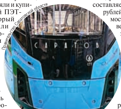
На совещании были озвучены окончательные сроки пуска скоростного трамвая.