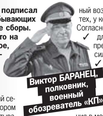
Виктор БАРАНЕЦ, полковник, военный обозреватель «КП»

На время прохождения военных сборов запасники освобождаются от работы или учебы с сохранением места и получают средний заработок или стипендию по месту постоянной работы или учебы.