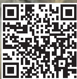
Фото присылайте в «Комсомольскую правду», e-mail: miss@kp.ru

Голосуйте за понравившуюся вам участницу на нашем сайте KP.RU в разделе «Будь стильной с «КП»!»