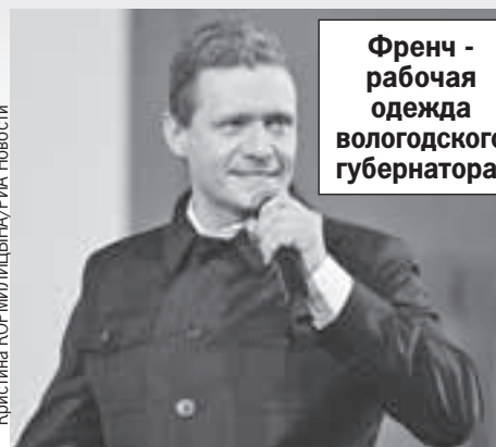
Френч - рабочая одежда вологодского губернатора.