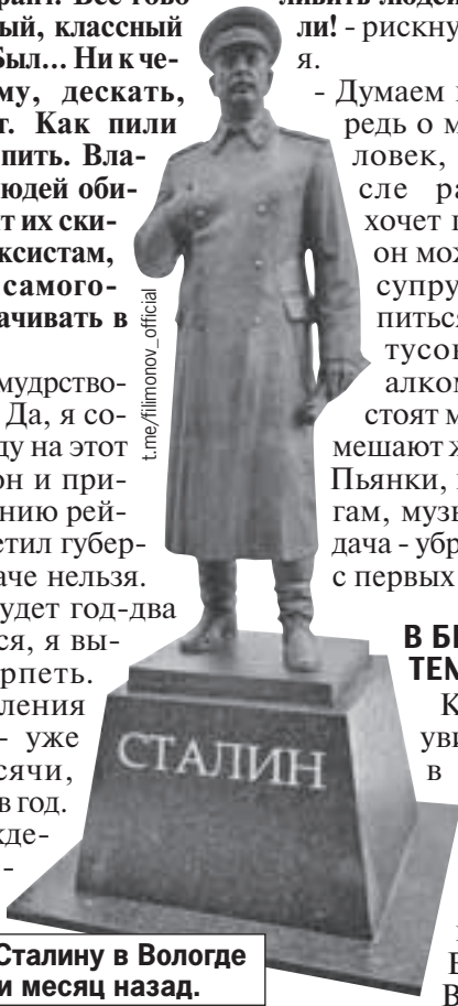
Памятник Сталину в Вологде открыли месяц назад.

- Я не буду мудрствовать лукаво. Да, я сознательно иду на этот шаг, пусть он и приведет к падению рейтинга, - ответил губернатор. - Иначе нельзя. Пусть это будет год-два продолжаться, я вынужден терпеть. Убыль населения в области - уже не 7,5 тысячи, а 8,5 тысячи в год. Пьяное вождение, поножовщина,