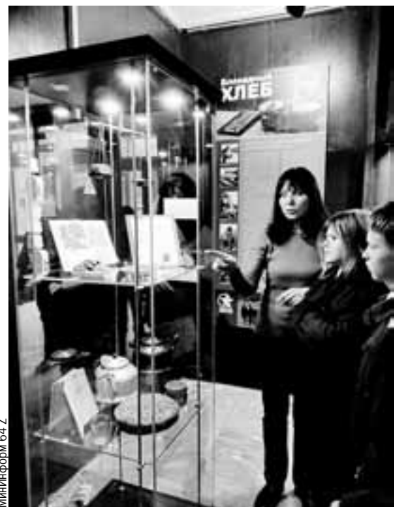
Посетители узнают об условиях жизни в осажденном городе.

Посещение выставки доступно по Пушкинской карте.