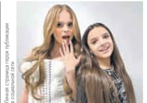
Личная страница героя публикации в социальной сети